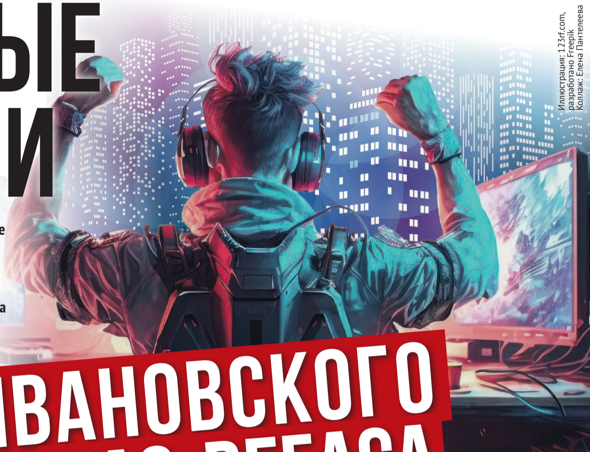
Иллюстрация: 123rf.com, разработано Freerik Коллаж: Елена Пантелеева

Типичный компьютерный клуб конца 90-х – полуподвальное тёмное помещение, куда стекались подростки, чтобы делать всё, что категорически запрещено дома: рубиться до посинения в сетевую «бродилку-стрелялку», курить, пить слабоалкогольные коктейли, а то и наркотиками себя побаловать. Казалось, подобная форма молодежного досуга ушла навсегда после широкого охвата населения безлимитным интернетом. Но, как выяснилось, компьютерные клубы функционируют в Иванове и поныне. Только легальных насчитывается целых шесть, остальные – в серой зоне.