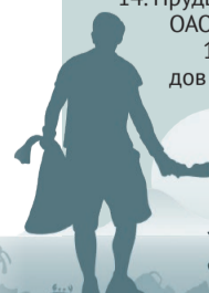
Фото: 123rf.com, коллаж: Алексей Беленёв